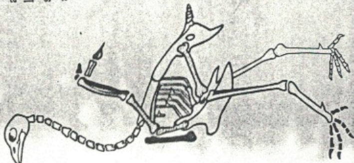
Fig. 123. — Squelette de coq. Trouvez les noms des os en comparant avec le squelette du Pigeon (fig. 111).

Le Coq se redresse, prend une allure altière et souvent combattive. Il porte haut la tête, surmontée d'une crête écarlate bien développée, ornée sous le bec de deux longues lames de corne (fig. 124). Il est fier d'un plumage étalant, d'une queue en panache avec deux plumes en faucille. Chacune de ses pattes est garnie d'un ergot . Le Coq salote le soleil de son cocorico sonore.